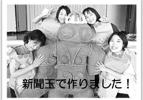
新聞玉で作りました！