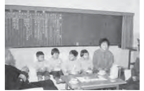
11月 園長先生、慶徳先生に引率され 海上自衛隊へ職場訪問に