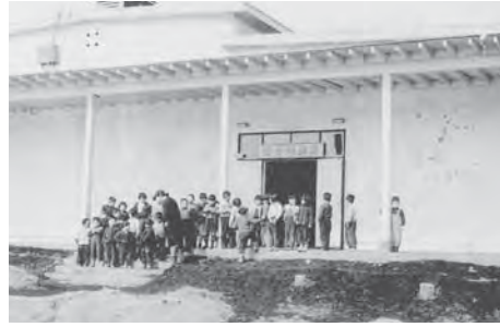
元駐留軍幼稚園舎