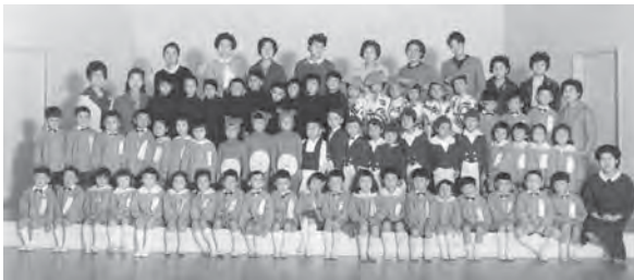
10月20日 千葉バザーにて「正城寺の狸ばやし」を踊る