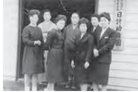
卒園式当日の先生と役員の皆さん