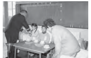
11月24日 勤労感謝の日にちなみ、 海上自衛隊へ花束を持って