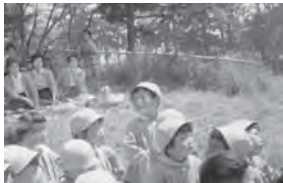
6月17日 三八城公園へ親子遠足