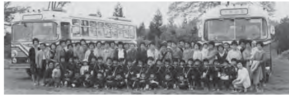
市営バスの前で記念撮影 すみれ組