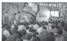
サンタさんからプレゼントが