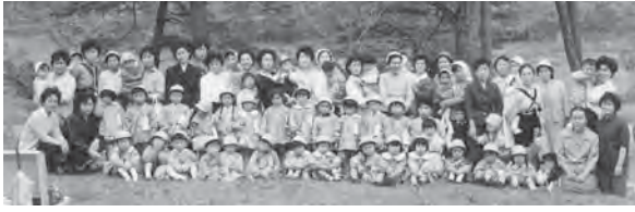
5月29日 六戸公園へ親子遠足