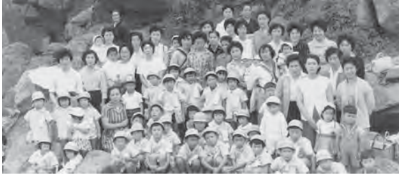
7月 種差海岸へ海浜保育