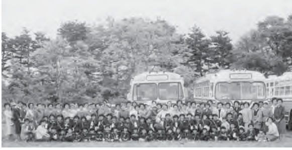
制服に身を包み、春の遠足へ