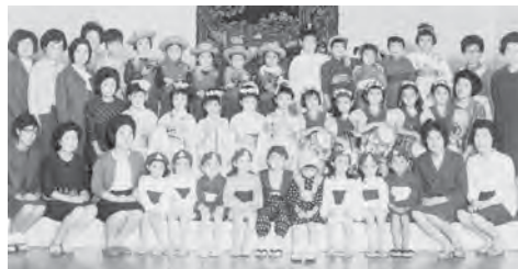
千葉バザー芸能祭に出演「小さなカーボーイ」を踊る