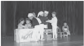
10月21日～23日 千葉バザーにて 「小人の靴屋」の遊戯を披露