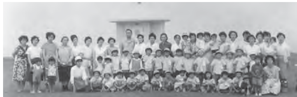
7月 角ヶ浜へ海浜保育