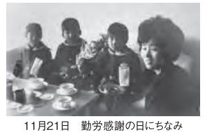
11月21日 勤労感謝の日になみ海上自衛隊へ花束を