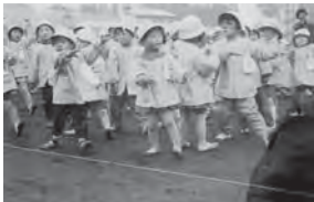
5月15日 八戸市体操祭に参加し、小人の体操を披露する

4月 地元の要請に応じて旧根岸小学校内に幼稚園を再開する。 初めての固定遊具「木製すべり台」を設置する。