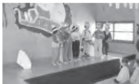
12月22日 クリスマス遊戯会にて