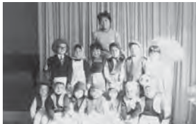
小人の靴屋さんの衣裳に身を包んだ子どもたち