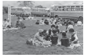
お友だちと一緒に弁当の時間