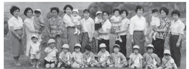
7月16日 種差海岸に海浜保育にてかけた年少組の子どもたち