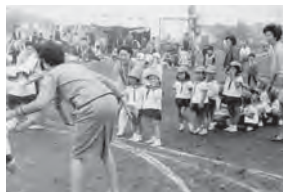
海上自衛隊のグラウンドを借りての運動会