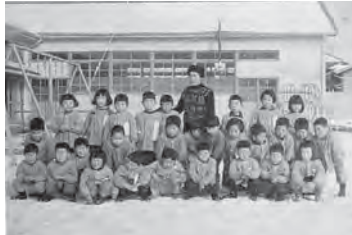
昭和33年4月～35年3月 この中の数名が園閉鎖中に市営バスで 類家の千葉幼稚園へ通う